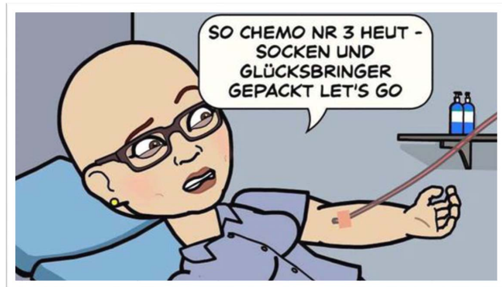
Mit diesem Comichild zeigt Sabine Oberhauser Humor bei ihrem Kampf gegen den Krebs.